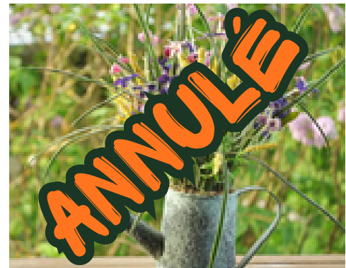
Les fleurs embellissent nos rues.

Fin Juin, les jeunes du CMJ, accompagnés d'élus devaient parcourir les rues du village afin d'évaluer les maisons et balcons fleuris. Malheureusement nous avons été contraints d'annuler le concours à cause des fortes chaleurs qui sévissent en cette fin juin.