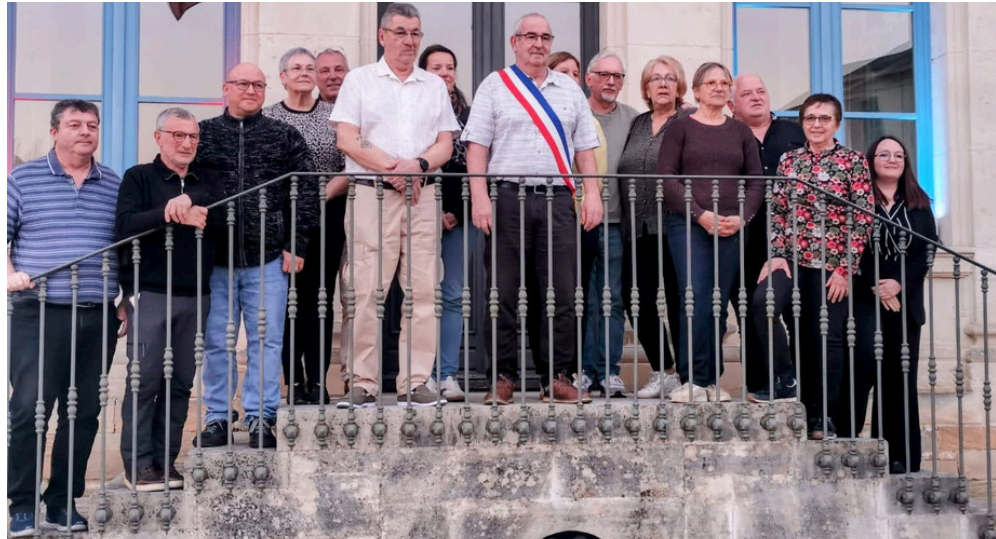
Les membres du conseil municipal après leur premier conseil.

Ainsi 11 commissions ont été créées. A savoir : Finances, Travaux, Affaires scolaires, Communication, Solidarité, Environnement, Fêtes, Vie associative, Aînés, Patrimoine et enfin Vidéosurveillance.