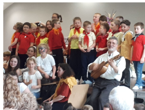
Silence, on chante !

La réussite de ce projet a reposé sur l'implication des enseignantes et personnels éducatifs, ainsi que sur le soutien de la DRAC, de l'INEC Mission Voix Lorraine, du Département de la Meuse, de l'agglomération Meuse Grand Sud et de la Mairie de Tronville.