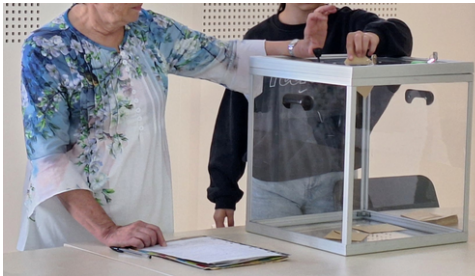
Passage aux urnes pour le vote.

Bravo à eux pour leur engagement et merci à tous les votants !