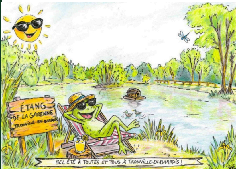
Illustration d'Elodie Gélin (Conseillère municipale)