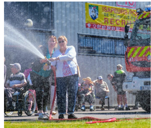
Pompiers accueillant les résidents d'un EHPAD...

Après avoir partagé un goûter offert par la caserne, tous les résidents sont repartis avec des souvenirs plein la tête !