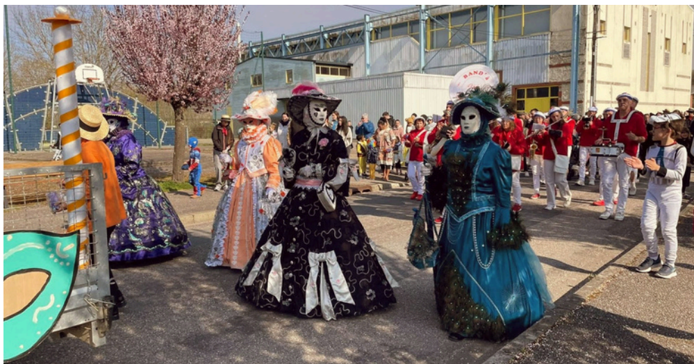
Le défilé du carnaval dans les rues du village en musique.

Le village de Tronville-en-Barrois avait revêtu ses habits de fête, ce samedi 21 avril 2026, à l'occasion du traditionnel carnaval, organisé par Tronville Animation, avec le soutien de la municipalité. Les festivités ont commencé dans la cour de l'école du Bouvret où les enfants et les enseignants déguisés pour la circonstance ont pu présenter quelques danses. La manifestation a