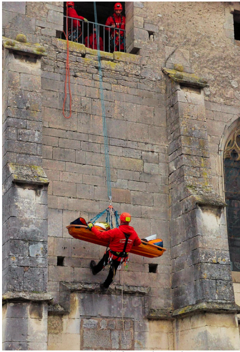
Pompiers défiant le vide...

Le samedi 28 mars, à l'église de l'Immaculée Conception, l'équipe spécialisée GRIMP de la Meuse, avec le centre de secours de notre commune ont effectué plusieurs manœuvres d'entraînements. Impressionnant !