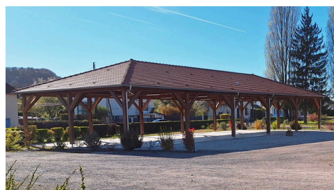
La Halle place du Railly

Alors pas d'hésitation, on vous attend nombreux pour la suite de cette saison prometteuse pour ce marché qui propose de bons produits locaux.