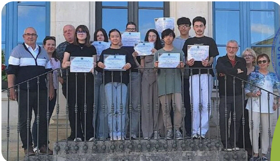
Sur le perron de la Mairie, fiers, les membres élus montrent leur certificat d'élection au conseil municipal des jeunes.