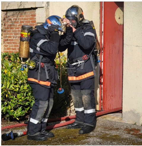
Pompiers en manœuvre...

Le mardi 14 avril 2026, une formation départementale a été proposée par le SDIS 55, dans notre commune de Tronville, en direction de jeunes recrues meusiennes. Le but de cette intervention dans le lavoir enfumé de la rue de Maulan, était pour ces jeunes volontaires, de découvrir le matériel de lutte contre l'incendie et d'apprendre des techniques adaptées à ce type de sinistre.