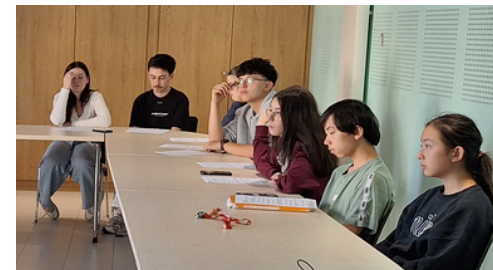
Travail sérieux dans la salle du conseil municipal

La séance s'est clôturée à 18h40 autour du pot de l'amitié.